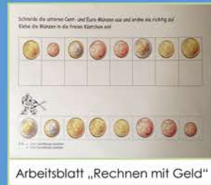
Arbeitsblatt „Rechnen mit Geld“