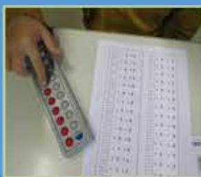
Freiarbeit: Rechnen im ZR bis 20 - Rechnen mit dem Abacco, Logico,