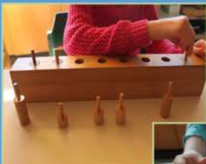
Freiarbeit - nach Gewicht, Größe, Farbe und Form sortieren