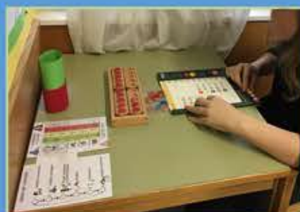
Rechnen im Zahlenraum bis 1000