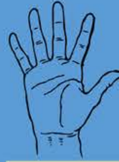
Zählen und Rechnen mit den Fingern