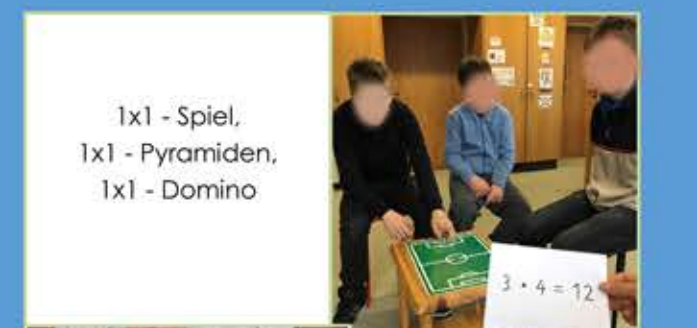
1x1 - Spiel, 1x1 - Pyramiden, 1x1 - Domino