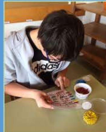
Freiarbeit Klammerkarte - Menge bis 20