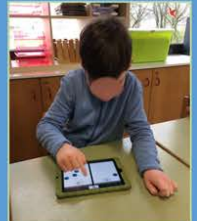
Arbeit mit dem iPad