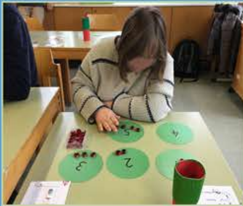
Freiarbeit Mengen bis 10