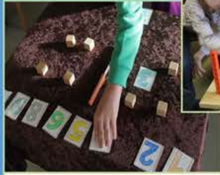
Mengenerfassung im Zahlenraum bis 10