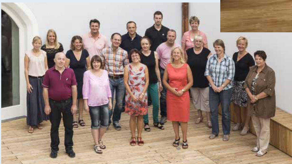
Mitarbeiterinnen und Mitarbeiter der Zentralen Verwaltung mit Geschäftsführung